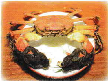
カニは味はもちろん、 見た目にも美しさがあります。