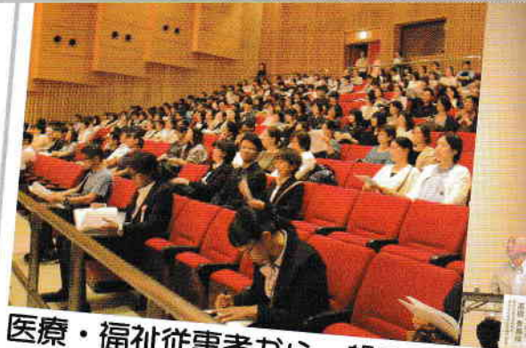
医療・福祉従事者から一般の市民までたくさんの方が耳を傾けたシンポジウム

「介護のしごと」を考えている方、経験のない方、興味・関心のある方、お気軽にお問合せ下さい。施設見学も随時対応しております。