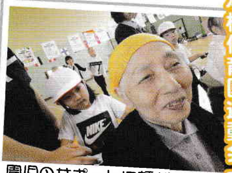
園児のサポートに顔がおもわずほころびます♡