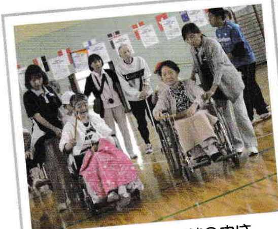
外は寒いけど、体育館の中はホットな競い合い!! 魚釣り競争☆