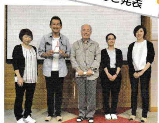
～表彰式～終わってホットした発表者のみんさんでした!!