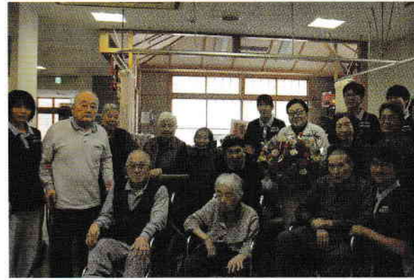
～記念撮影～通所リハビリの利用者様も一緒にお祝い♪