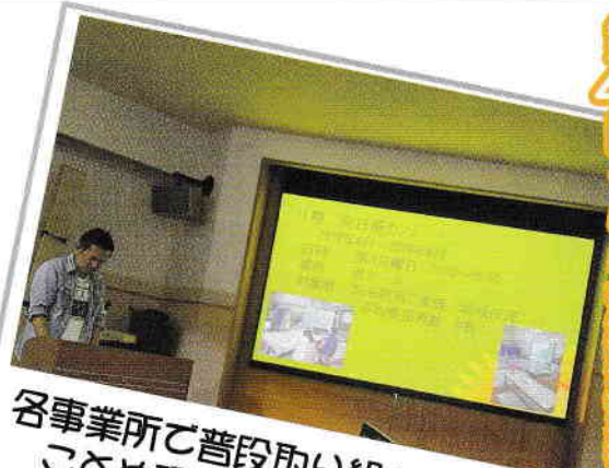
各事業所で普段取り組んでいることや研究していることを発表