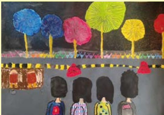
「岩手の花火を見たよ」