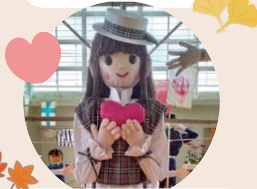
上田地区文化祭で展示されました