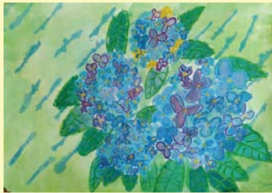
「色どりのあじさい」