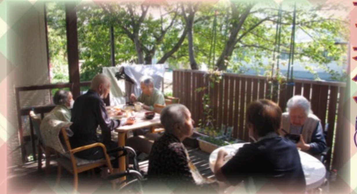
ベランダでランチ