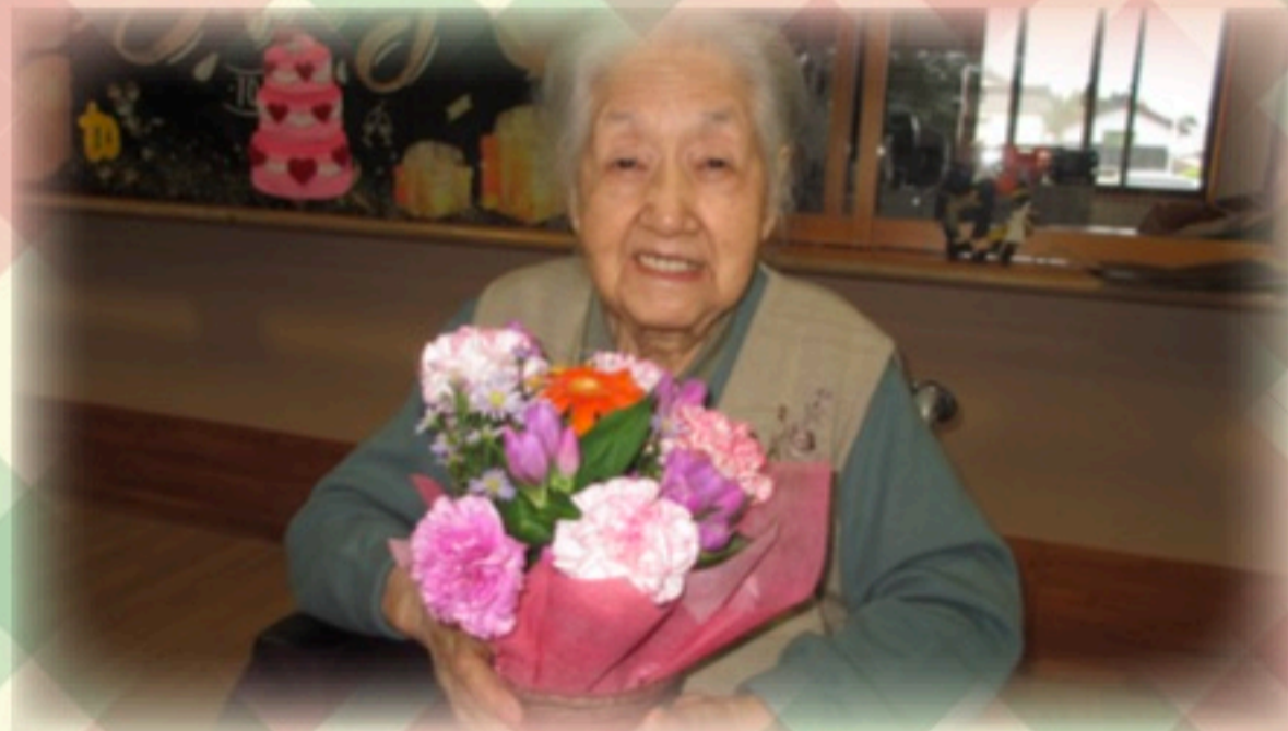
誕生日おめでとうございます！