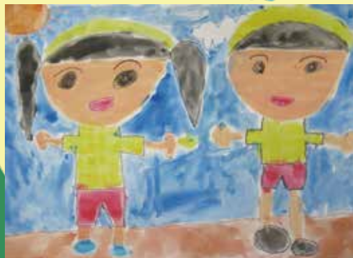
「うんどうかいでリレーをがんばったよ！」