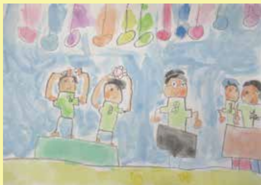
「ほんぼんでじょうずにがっそうできたよ！」

1978年とありました。バレンタイン・デーの贈り物を貰った私も今からホワイトデーに何を贈れば良いか思案中です。この時期になると、全国から(過去に注文したことがあるからか)広告のダイレクトメールやインターネットの宣伝が届くので選択肢が多いのですが、一年に一度の贈り物なので余計に悩みます。